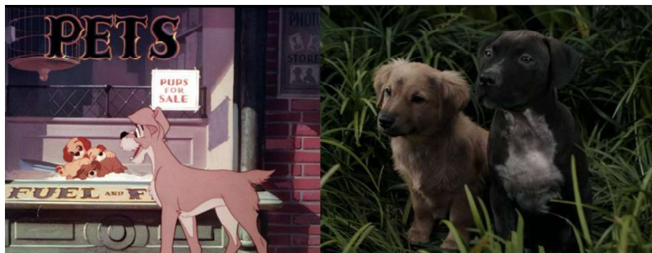
Figura 9 – I cuccioli

Nel FAC vi è una scena in cui Biagio gira per la città in cerca di cibo e vede dei cuccioli, simili a Lilli, in vendita nella vetrina di un negozio. Nel RLAM questa scena viene sostituita con quella di due cuccioli di razze diverse, abbandonati e affamati. Biagio, dopo aver rubato del cibo da un signore, vede questi cuccioli e dona loro il suo panino.