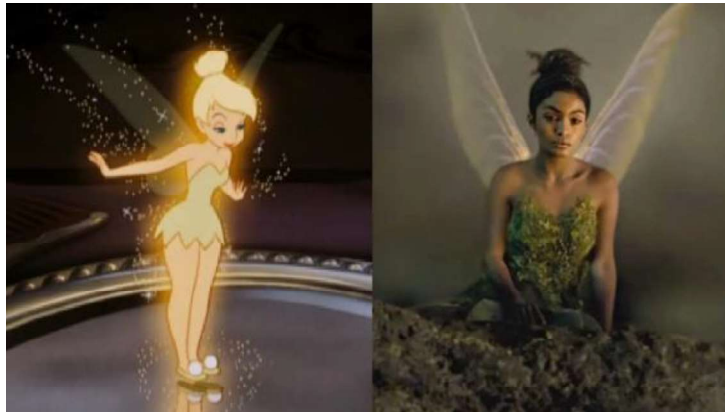
Figura 3 Trilli: comparazione FAC e RLAM

Anche il personaggio di Trilli subisce una trasformazione radicale rispetto al FAC. Mentre nel cartone animato viene rappresentata come una fatina bionda dagli occhi azzurri, nel RLAM è interpretata da Yara Shahidi, una ragazza afroamericana, apportando una maggiore diversità e ampiezza del casting. Inoltre, nel FAC, Trilli viene spesso dipinta come gelosa di Peter Pan e insicura del proprio aspetto fisico. Tra gli esempi, si citano una scena in cui si specchia e si rende conto dei suoi fianchi larghi [00:11:40], un'altra in cui non riesce ad uscire da una serratura del cassetto sempre a causa del fisico [00:12:53], mettendo così in evidenza e talvolta ridicolizzando agli occhi del pubblico le sue insicurezze. L'oggettivazione del corpo femminile è visibile anche nella scena in cui Peter Pan per diffondere la polvere di fata di Trilli, che inizialmente si rifiuta di dividerla con Wendy e i fratelli, sculaccia la fatina [00:17:51]. Tuttavia, nel film, Trilli si distacca da queste rappresentazioni stereotipate e viene ritratta come una fata sicura di sé, coraggiosa e determinata.