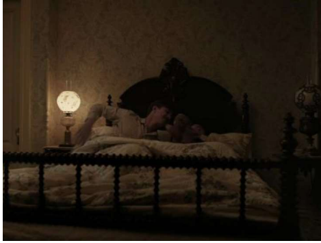
Figura 7 – Lilli sale sul letto

Altre differenze si possono notare nella scena in cui Lilli riceve la sua medaglietta. Nel FAC va prima a raccontare la grande novità al suo amico Whisky; mentre nel RLAM la cagnolina va prima dall'amico Fido e dopo un po' entra in scena la sua amica Jackie. Infatti, nel RLAM, Whisky viene sostituito dalla cagnolina Jacqueline.