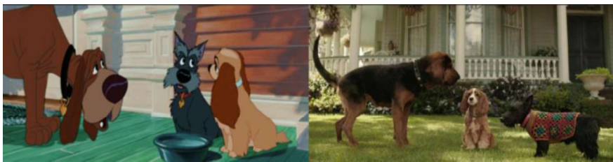
Figura 8 – Whisky e Jacqueline

Altre differenze si possono notare nella scena in cui Lilli riceve la sua medaglietta. Nel FAC va prima a raccontare la grande novità al suo amico Whisky; mentre nel RLAM la cagnolina va prima dall'amico Fido e dopo un po' entra in scena la sua amica Jackie. Infatti, nel RLAM, Whisky viene sostituito dalla cagnolina Jacqueline.