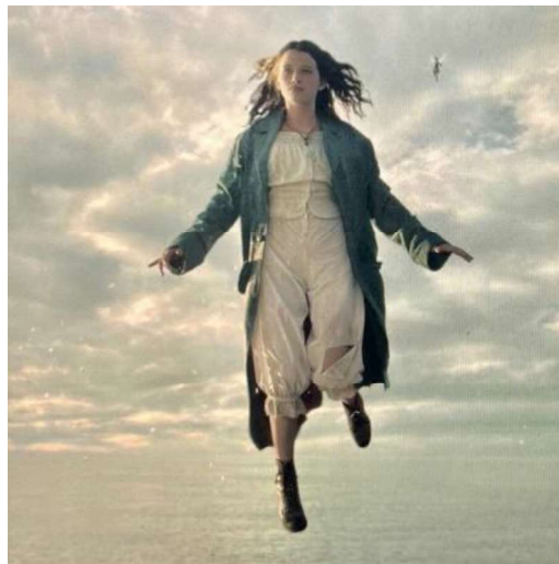
Figura 2 - Abbigliamento Wendy in 'Peter pan & Wendy'

Fin dalla scena iniziale del RLAM, in cui gioca con i fratelli con una spada, simulando un combattimento tra pirati [00:02:37], si intuisce che si tratterà di un personaggio desideroso di affermarsi e di prendere parte attiva alle avventure, a differenza del FAC, dove nella stessa scena, Wendy si occupa di sistemare le sue bambole e la camera, mentre i fratelli giocano con le spade di legno [00:03:00].