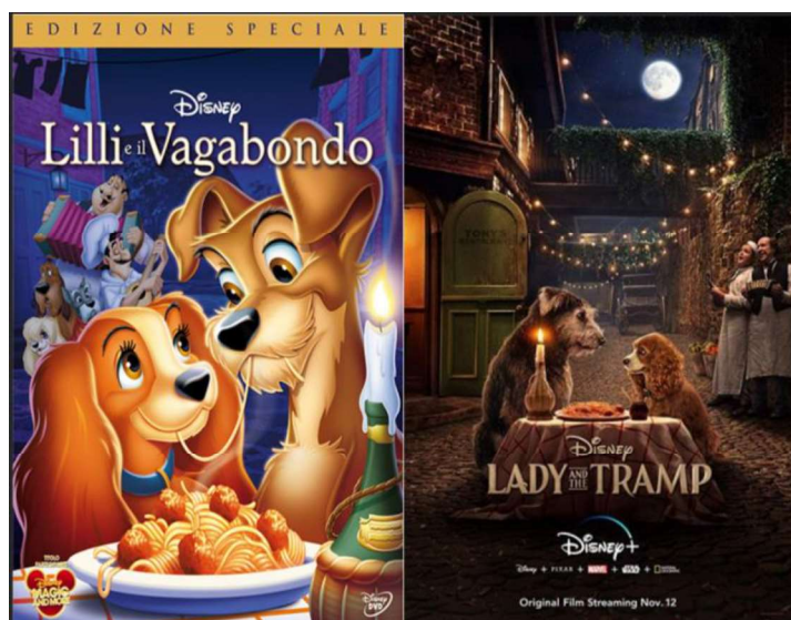
Figura 4 – Le copertine del FAC e del RLAM

La storia è incentrata su una femmina di cocker americano di nome Lilli che vive in una raffinata famiglia alto-borghese, e un maschio di cane meticcio randagio di nome Biagio.