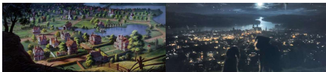
Figura 8 – Londra

In effetti, entrambi i film sono ambientati nella stessa città, Londra. Anche gli stati d'animo di Lilli e Vagabondo sono differenti: nel RLAM Lilli appare triste di aver lasciato la sua dimora: dice infatti che le mancano la sua casa e la sua famiglia, nel FAC, invece, è entusiasta di poter scappare.