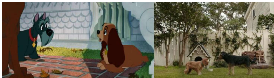
Figura 10 – Il cane deve andarsene

che il cane deve andarsene quando nasce un bambino in una casa: «ma ricordati, bimbina, nel cuore umano c'è posto solo per una data quantità d'amore e d'affetto; quando ci si piazza un pupo, il cane deve andarsene» [00:24:50]. Al contrario, nel RLAM, Lilli viene a conoscenza della gravidanza della sua padrona solamente grazie a Biagio, che le rivela in modo brusco cosa la aspetterà dopo l'arrivo del nascituro.