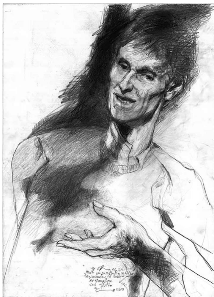
Ennio Calabria "Studio per un ritratto di Alberto. Asimmetrie del dubbio", 2021